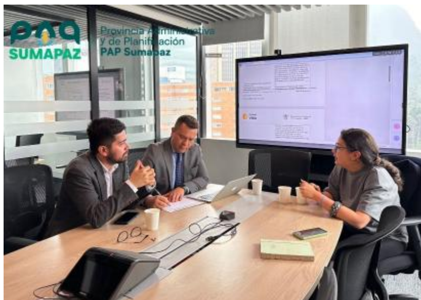
Inicio mesas de trabajo con el Departamento Nacional de Planeación Fotografía realizada el 29 de abril

En este documento se consolidaron los ajustes sugeridos por las secretarías de planeación para la elaboración del PEMP preliminar (adjunto). Con base en dichos aportes, el 24 de abril se definió el inicio de un trabajo colaborativo con el DNP, orientado a ajustar el documento conforme a las observaciones técnicas formuladas por esa entidad y a los lineamientos aplicables.