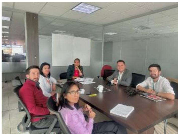
Mesa de trabajo Secretaría de Integración Regional con la PAP- Sumapaz, realizada el 14 de marzo

-Promover el desarrollo territorial e integración regional del Departamento a través del fortalecimiento y la asistencia técnica a la asociatividad territorial de los municipios interesados, y que decidan constituir esquemas asociativos territoriales y otros modelos o procesos asociativos que permitan generar sinergias y alianzas competitivas para el desarrollo regional.”