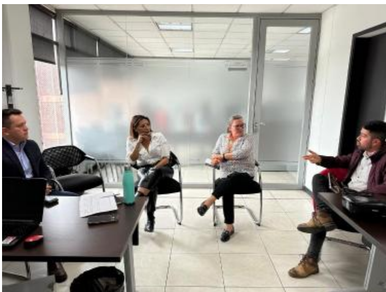
Mesa de trabajo Secretaría de Planeación y de Integración Regional con la PAP- Sumapaz, realizada el 8 de mayo